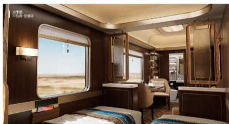
至尊金钻 6定员/节（效果图）

每节车厢设置3间标准双床房包厢（双床可合并为大床）。所有包厢均配备休闲双人沙发、休闲桌椅、独立卫浴，干湿分离，每节车厢可入住6位贵宾。